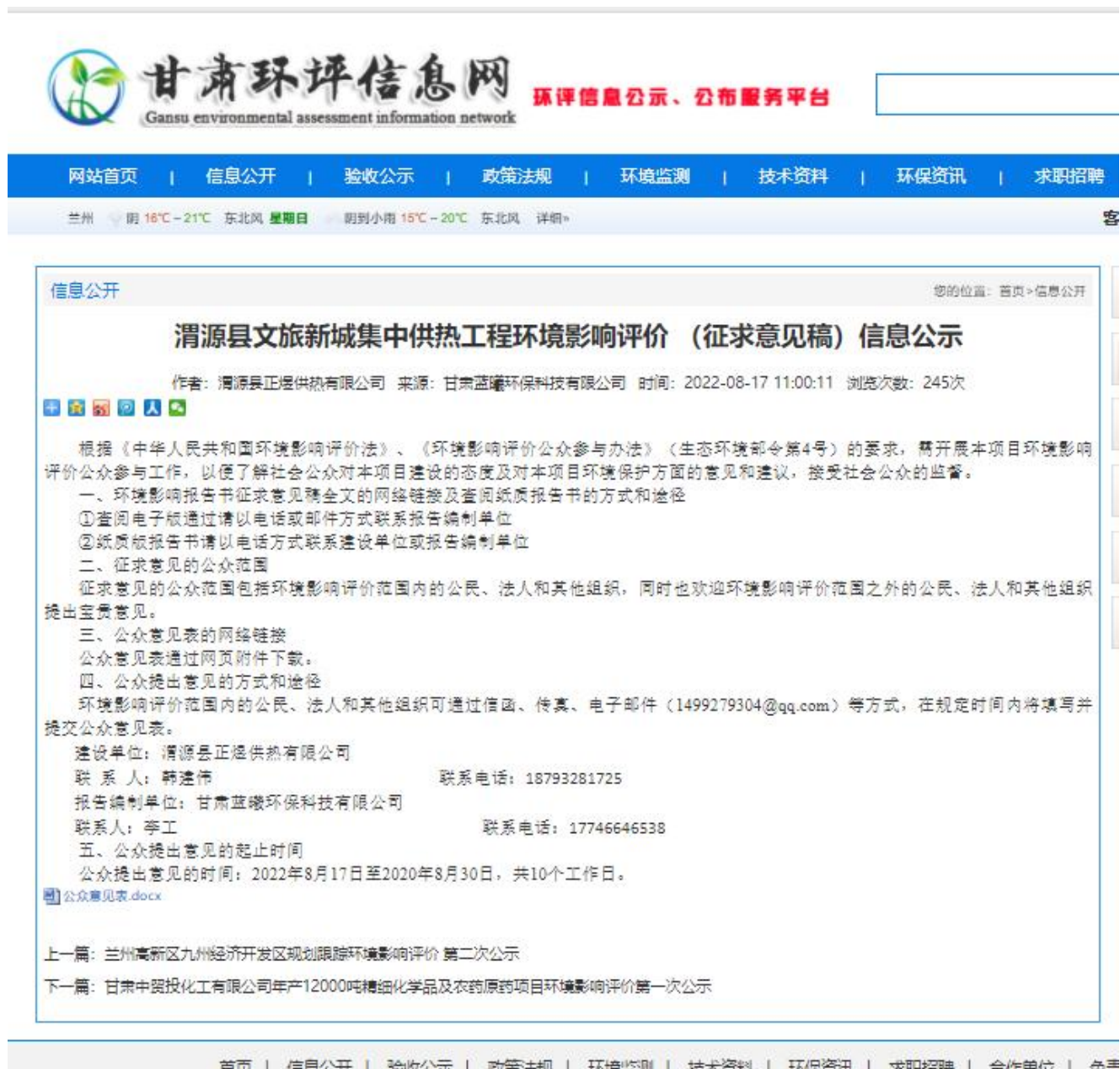
图 2 项目征求意见稿公示截图