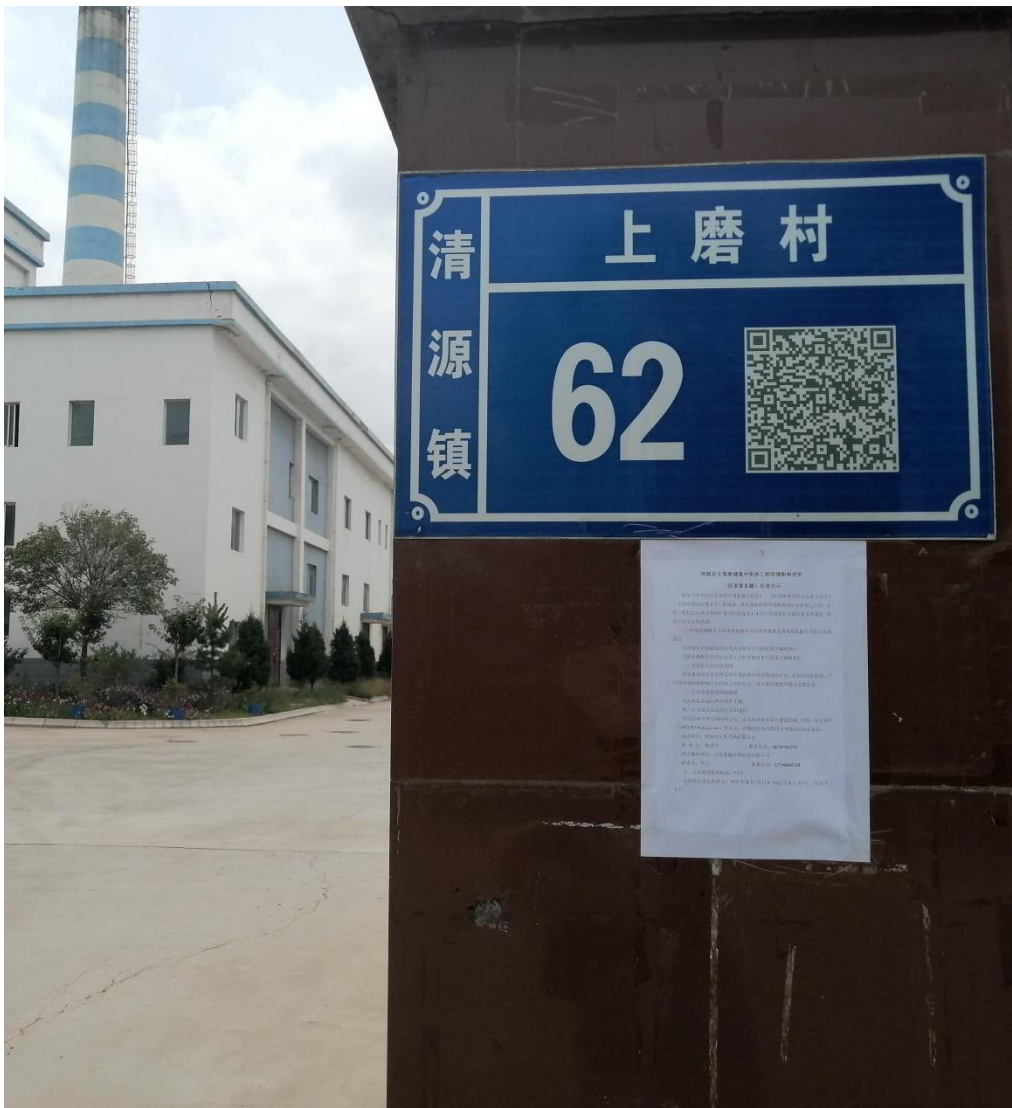
图 5 张贴公示照片