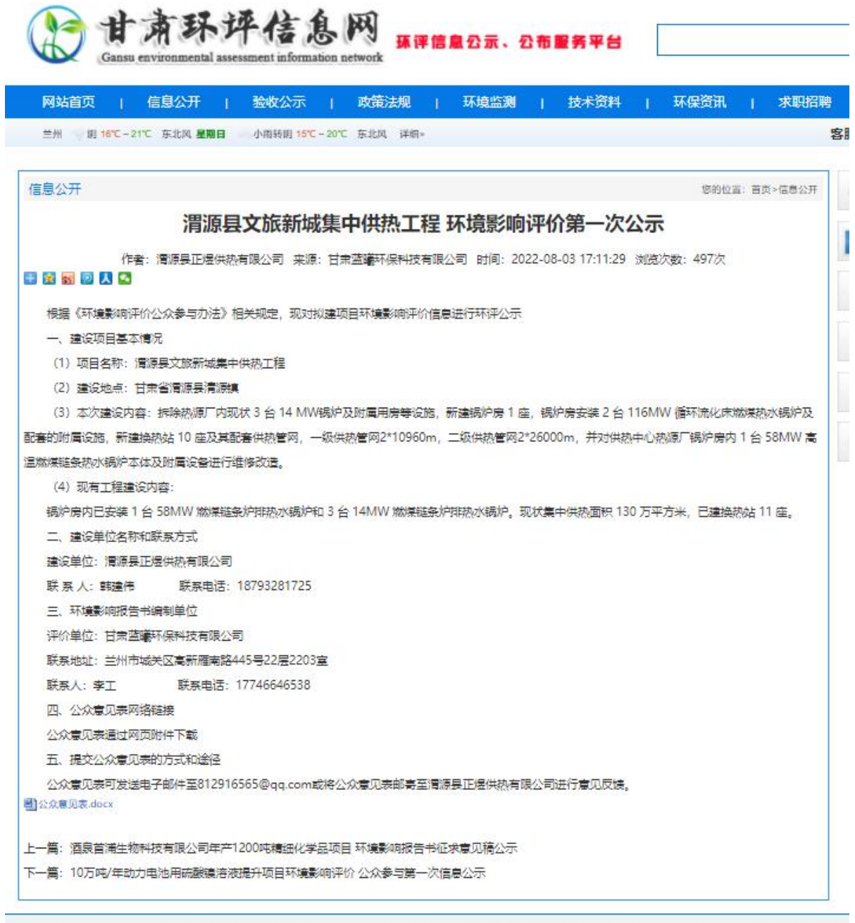
图 1 项目第一次公示截图

公示载体选取项目所在地甘肃环评信息网网站（网络连接为： http://www.gshpxx.com/show/2514.html ）发布了项目环境影响评价公众第一次公示，以征询公众对项目建设的意见，公示日期为2022年8月3日，第一次公示截图见图1。