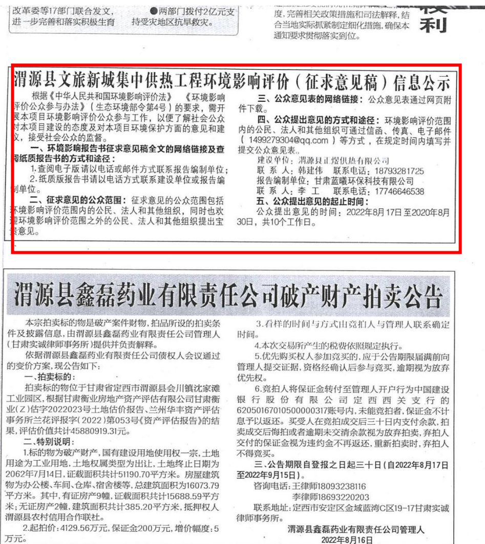
图3 报纸第一次公示情况

本项目境影响报告书征求意见稿形成后于2022年8月17日和2022年8月18日在《定西日报》进行了2次刊登公示，符合《环境影响评价公众参与办法》第十条“通过建设项旧所在地公众易于接触的报纸公开，且在征求意见的10个工作日内公开信息不得少于2次”的规定。报纸公示截图见图3和图4。